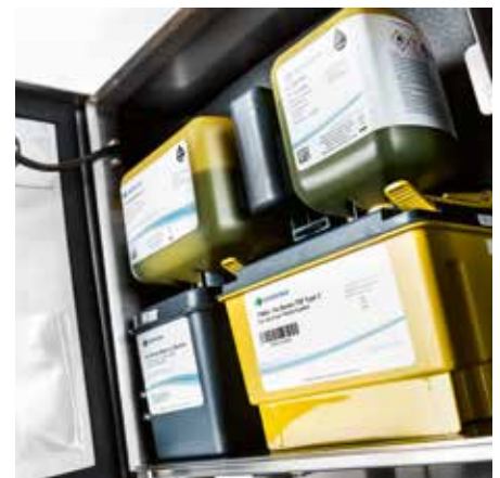
▶ Kartuschen für Tinte und Make-up sowie i-Tech-Filtermodul – alle mit RFID-Prüfung

Design, Fertigung und Wartungskonzept sind auf maximale Verfügbarkeit ausgerichtet. Die Zahl der Teile und Dichtstellen im Tintensystem konnte dank der Umsetzung mit einem zentralen Hydraulikblock deutlich reduziert werden. Für die komplette Anlage bietet Komax Service und Know-how aus einer Hand.